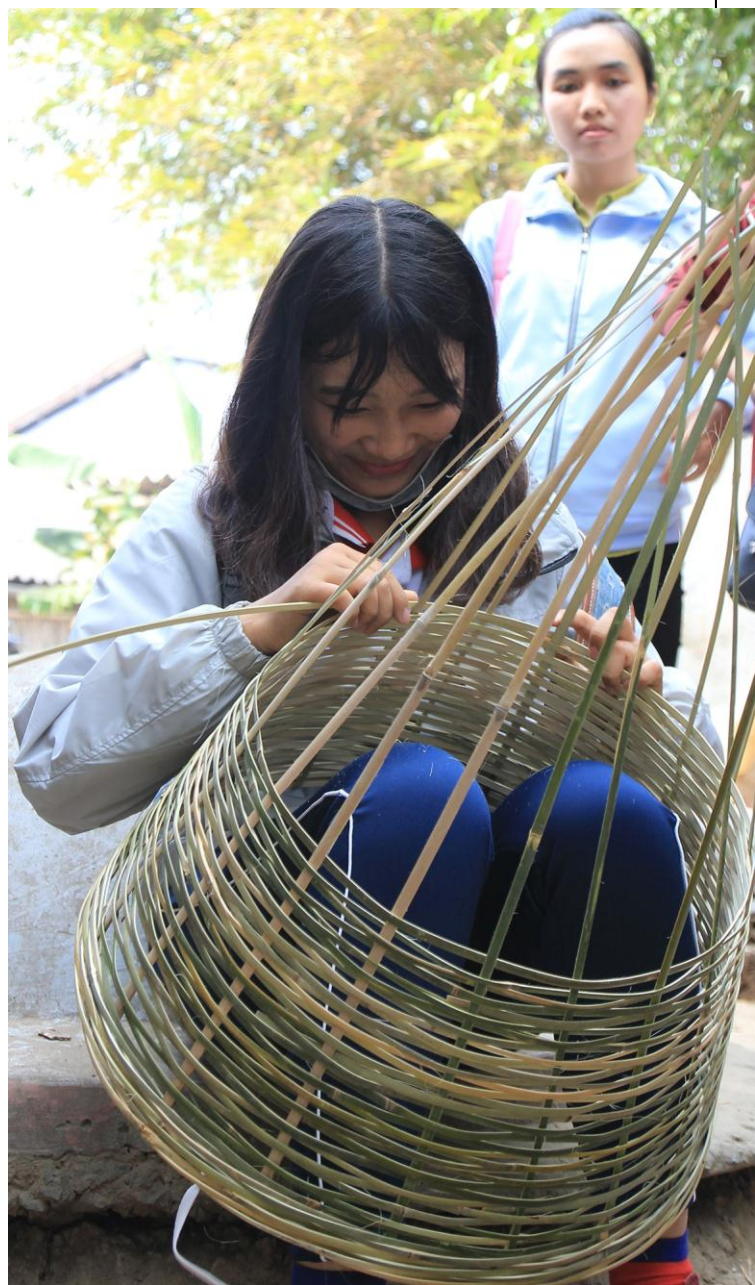
Đan hom bung