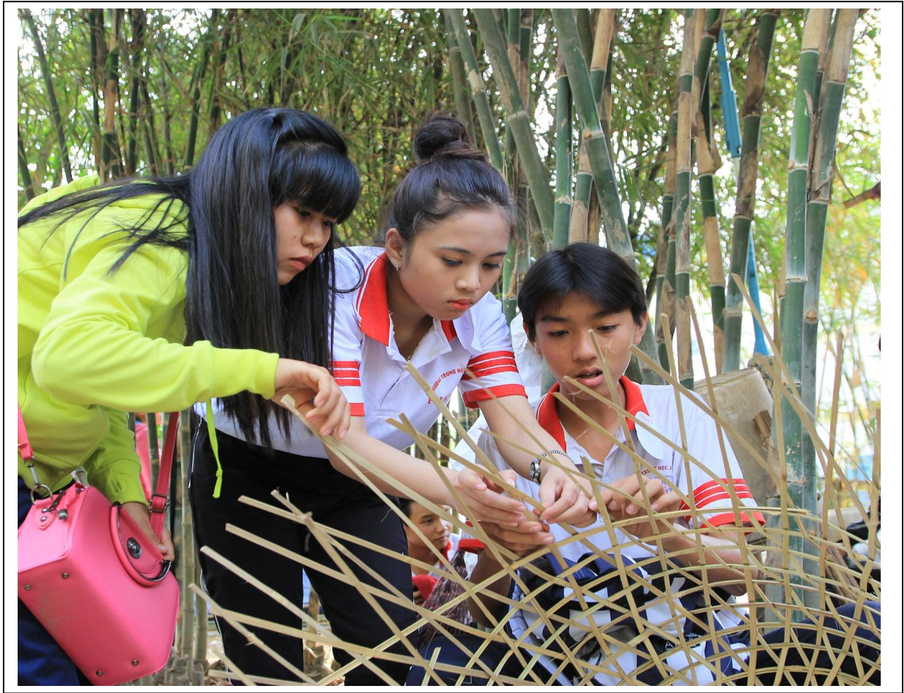
Thực hành đan bội