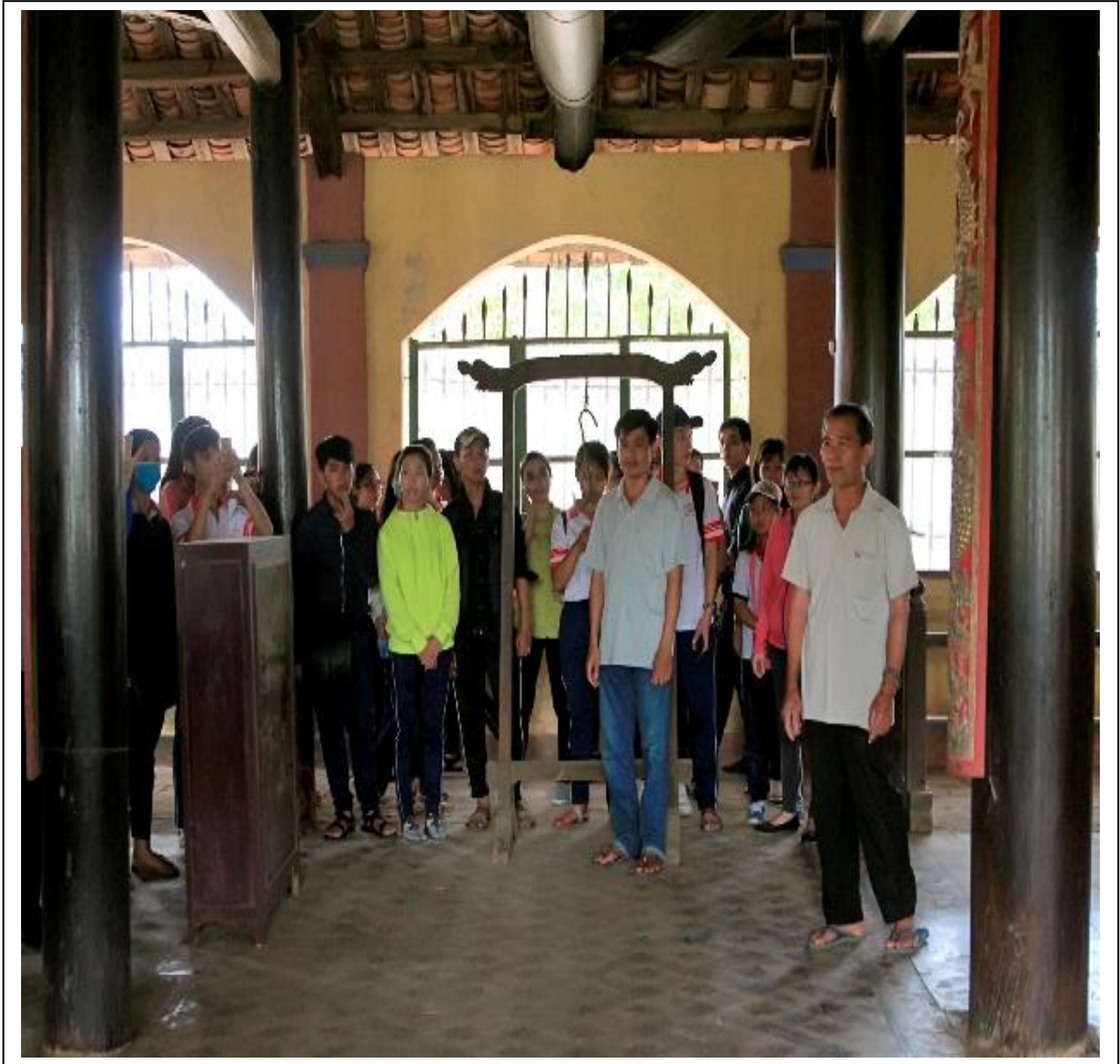
Tham quan bên trong đình Phú Lễ