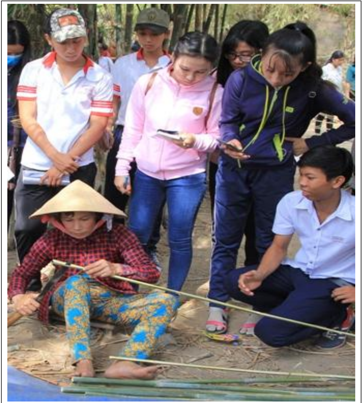
Nghệ nhân biểu diễn chẻ và chuốt nan